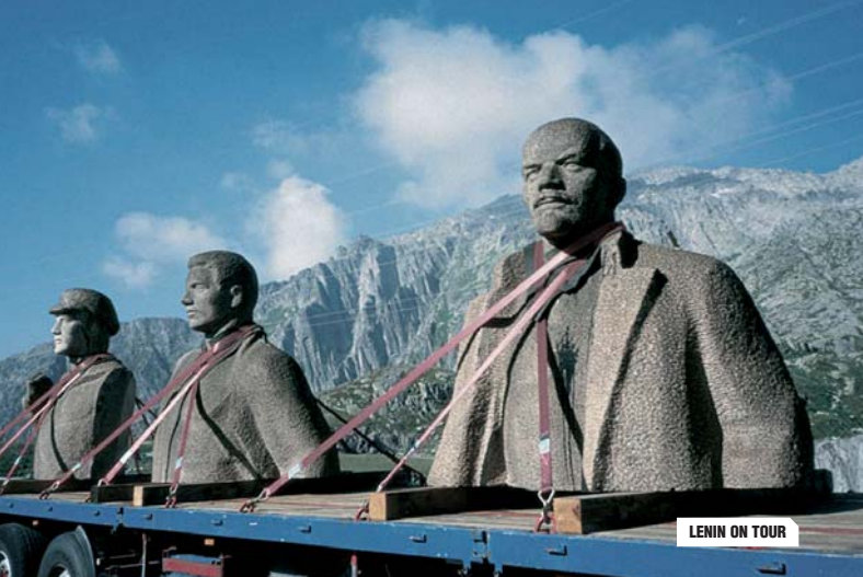
LENIN ON TOUR