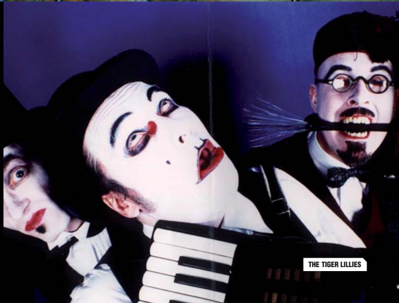
THE TIGER LILLIES